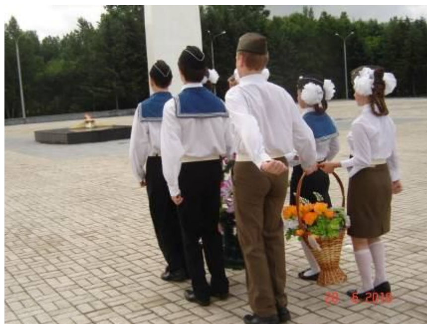
Возложение цветов к памятнику «Землякам- комсомольчанам, павшим в годы Великой Отечественной Войны».