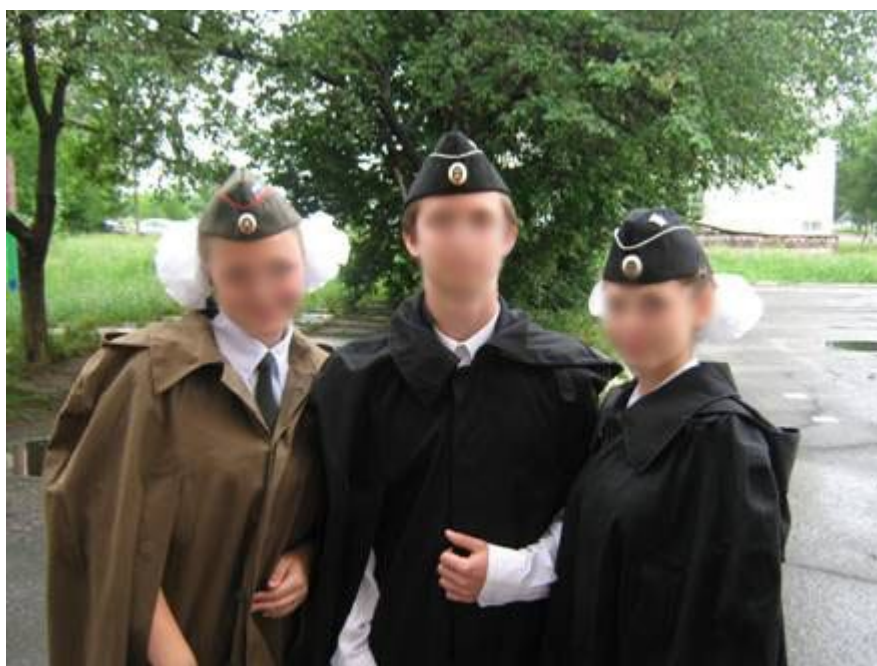
«И в дождь, и в слякоть...»