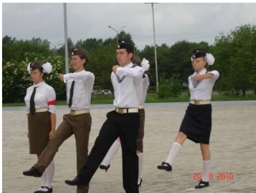
На Пост №1 у Вечного Огня заступает I смена.