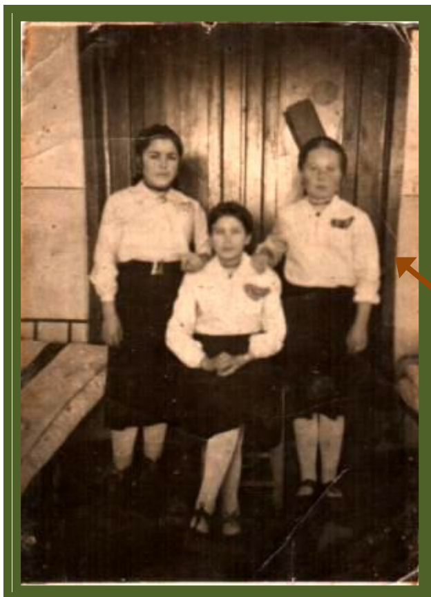
Казань. Ремесленное училище № 3, 1944 год