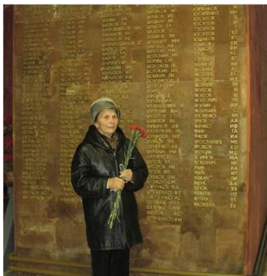
Моя бабушка у Стены памяти.

Если бы он мог, о чем бы спросил нас? Наверно, о том, как живут его дети, внуки и правнуки, как живет его любимый город на Сухоне и о том помнят ли его. А мы бы ответили, что ему есть чем гордиться и чему радоваться. У него выросли прекрасные дети, которые прожили жизнь честно и достойно, сейчас они воспитывают правнуков и, хотя им уже далеко за 70, полны оптимизма и любят жизнь. И то, что в нашей семье его помнят, и будут помнить всегда.