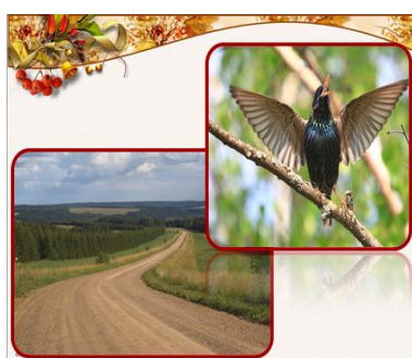
Слайд № 5