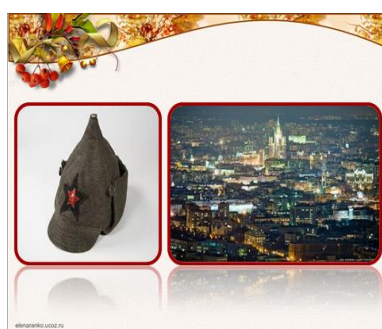
Слайд № 6