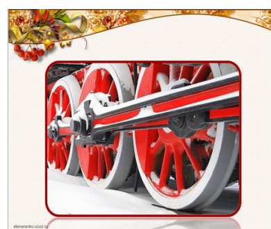
Слайд № 7