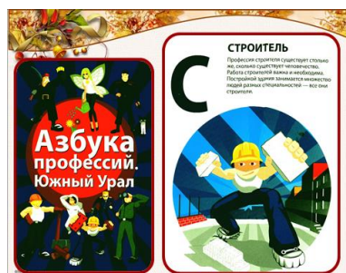
Слайд № 9