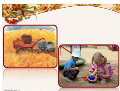
Слайд № 2