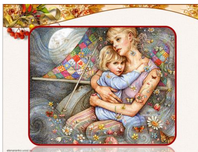
Слайд № 3