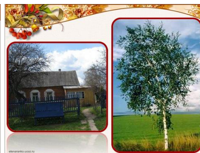
Слайд № 4