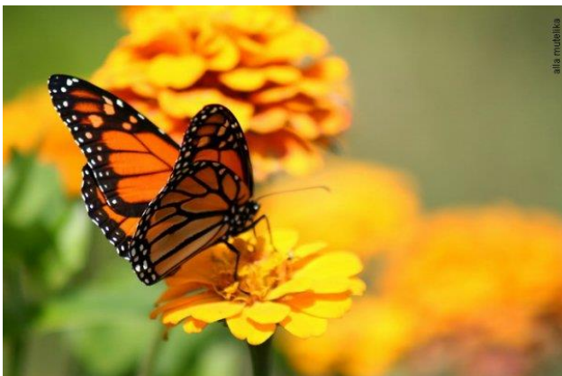
Бабочка порхает над цветком.