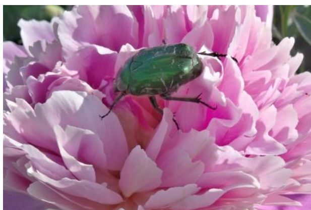
Жук спрятался в бутоне цветка.