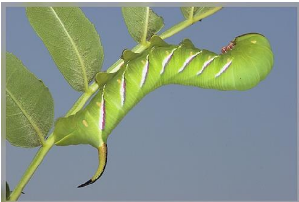
Гусеница ползёт по ветке растения.

- Составьте схему к каждому предложению.